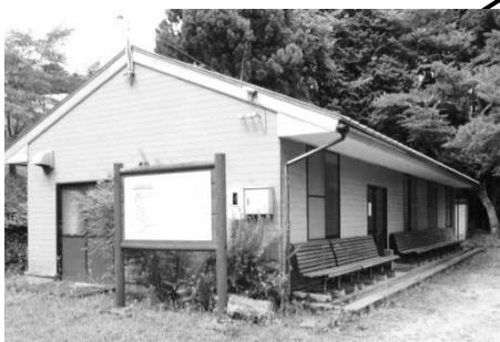
管理棟 建物前スペース有り ※管理棟では受付をしていません。