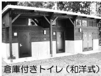
倉庫付きトイレ (和洋式)