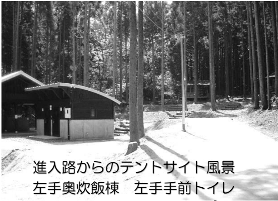
進入路からのテントサイト風景 左手奥炊飯棟 左手手前トイレ 右手奥テントサイト