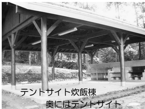
テントサイト炊飯棟 奥にはテントサイト