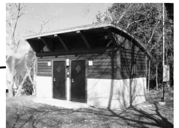
トイレ（男:和式、女:和洋式）

さんとうアウトドアビレッジ受付窓口 一般社団法人 山東自然の家 兵庫県朝来市山東町栗鹿 2179 電話 079-676-4100 ファクス 079-676-4466