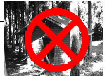
ログ風トイレ（洋式）